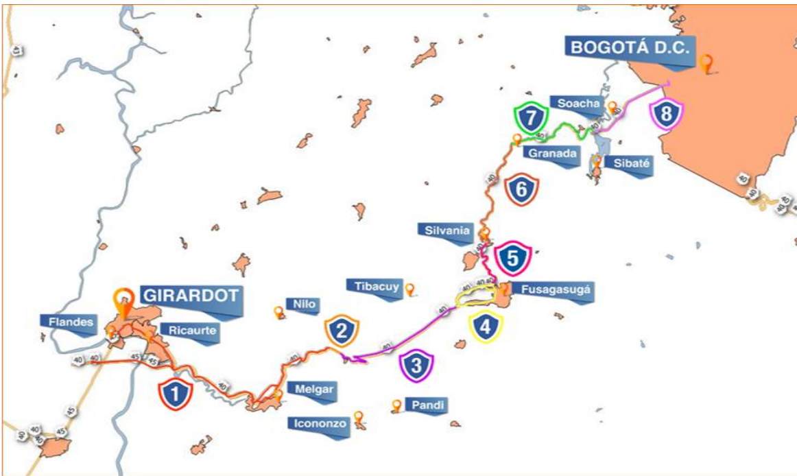
Figura 1 Localización general del proyecto